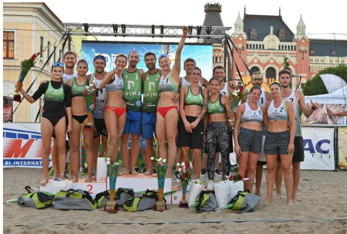
Podiumul Oradea Tournament