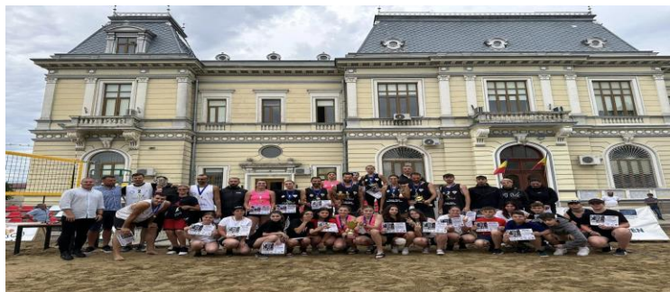
Premierea Rm. Sărat 2023